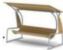
Диван-качели (с навесом) (Артикул 8036)