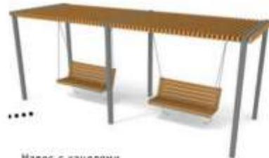
Навес с качелями