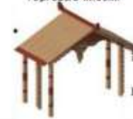
1 Входная группа